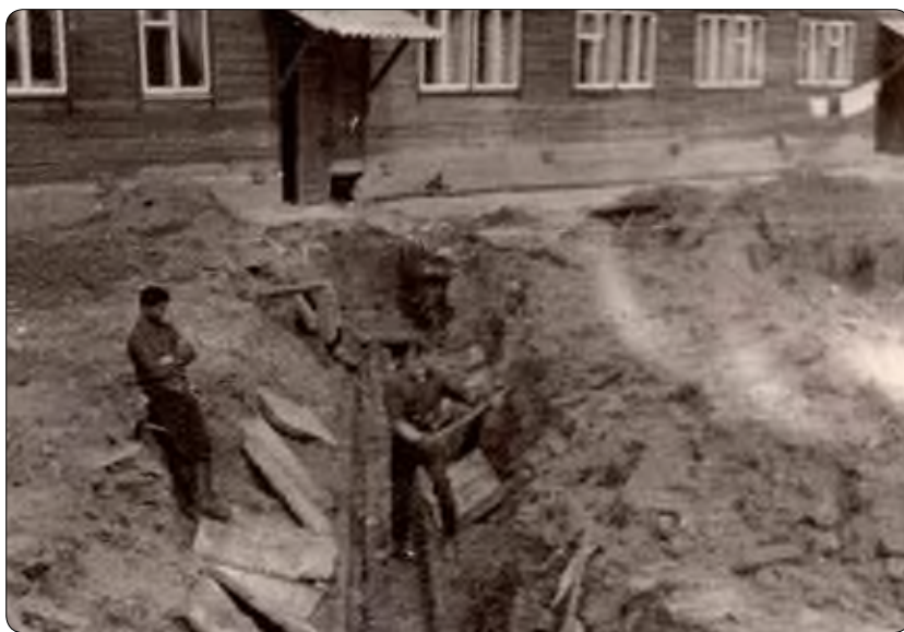
Какой-никакой, а трубопровод...