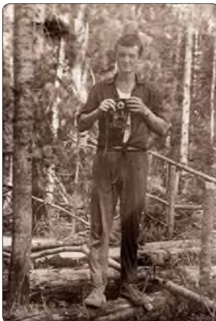
Редкий выходной в тайге близ Нефтеюганска в августе лета 1969-го

Надо признаться, мы уже давно избалованы иной техникой. И, если где бываем, для съемок, конечно, используем современную цифровую фотокамеру. Или мобильный телефон с соответствующими функциями. Качество – не сравнишь, возни никакой. В то же время можно поупражняться с компьютерной обработкой.