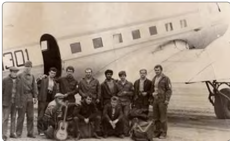
Улетели из Нефтеюганска 25 августа на ИЛ-2, выполнявшем спецрейс на Омск.