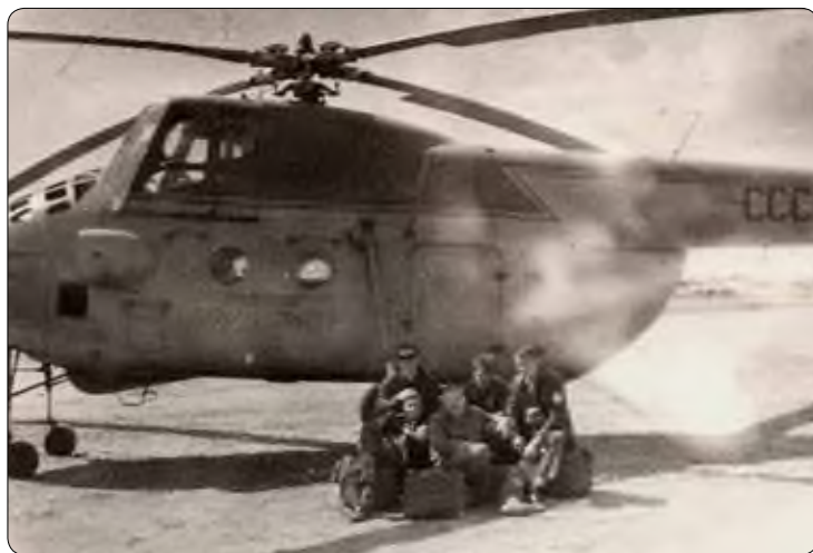
Перед вылетом в Нефтеюганск. Сургут. 17 июня 1969 года

Лету около часа, на небольшой высоте, а внизу вода, вода, вода — Обь в среднем течении, протоки, разливы. Без конца и края, как песок в Кара-Кумах (песок в Кара-Кумах довелось увидеть годом позже).