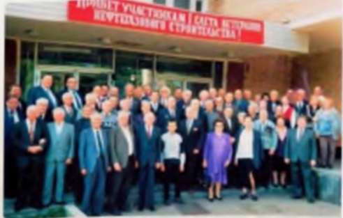
Ветераны войны и труда, участники войны за освобождение Сталинграда, участники войны на К. о. фронта, участники войны за освобождение Сталинграда.