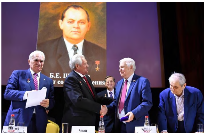
Вручение медали Щербины Николаю Ивановичу Рыжкову

Состоялась торжественная церемония вручения ветеранам нефтегазового строительства и создания топливно-энергетического комплекса медали Щербины за 2019 год.