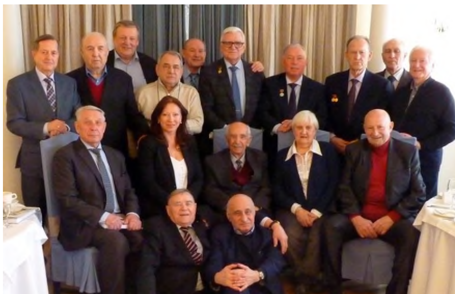
Фото на память. Москва. 28 марта 2019 года.