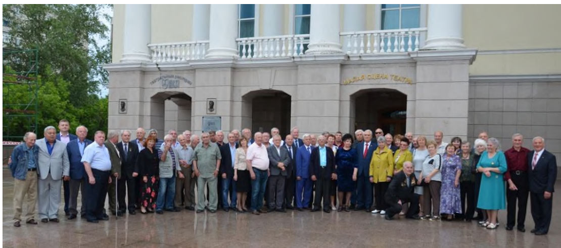
Фото на память. Тюмень. 4 июля 2019 года.

4 июля в Тюмени прошли встречи и мероприятия, посвящёнными 50-летию создания одного из первых комсомольско-молодёжных трестов «Тюменгазмонтаж».